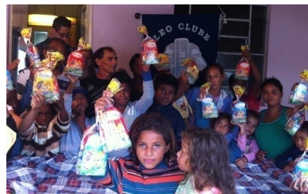
Vila Maringá – Proj. Atiliano