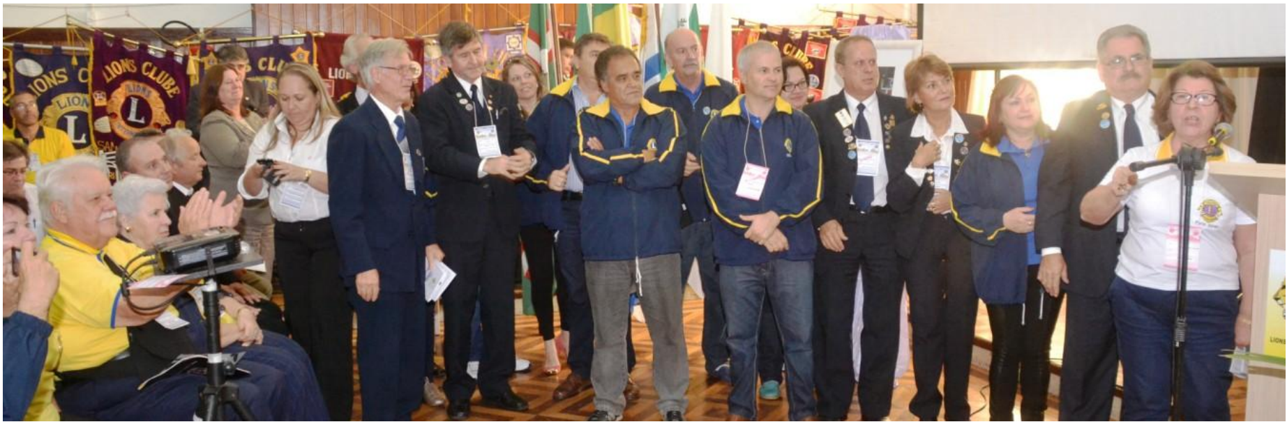
Momento da Decisão! CL Dal PivaCAL Gema 2º Vice Governador