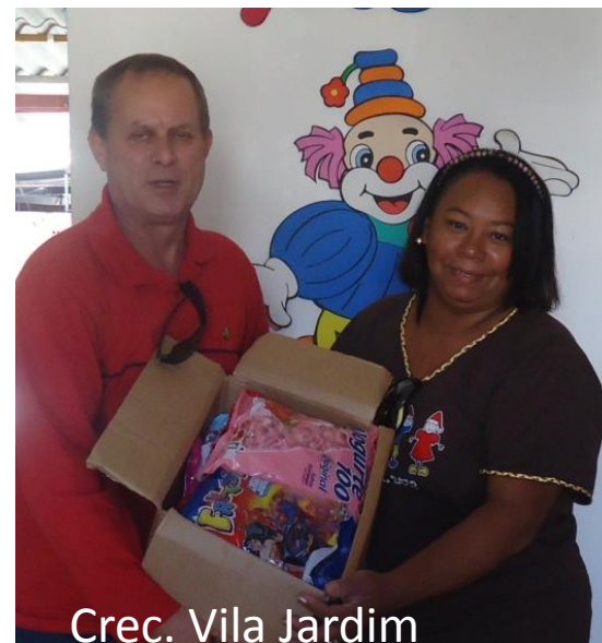
Crec. Vila Jardim