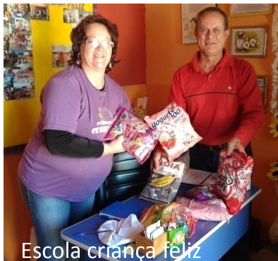
Escola criança feliz